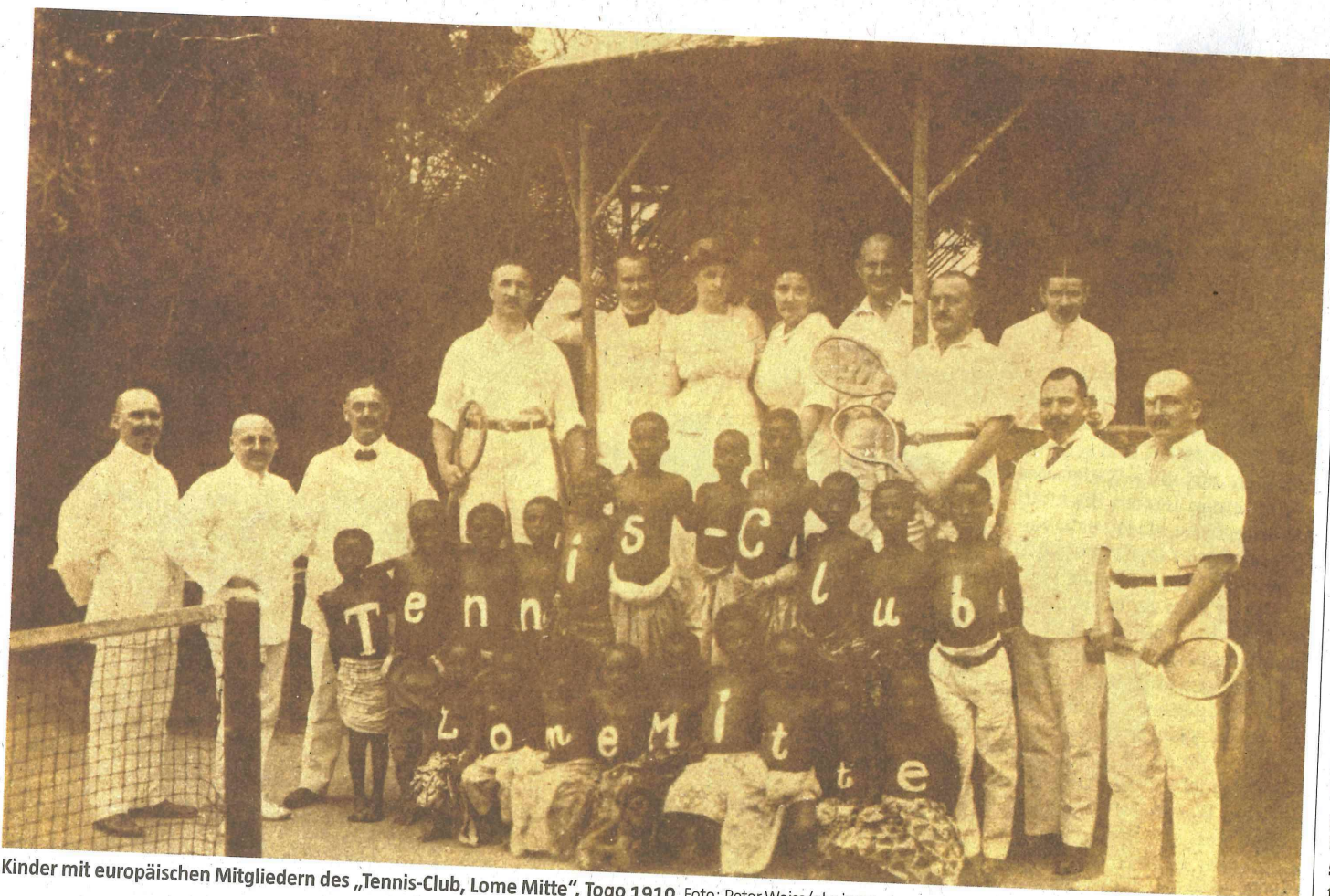
Kinder mit europäischen Mitgliedern des „Tennis-Club, Lome Mitte“, Togo 1910

HERRSCHAFT „Skandal in Togo“: Rebekka Habermas' bahnbrechende Studie zur deutschen Kolonialgeschichte